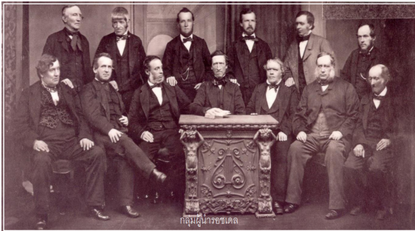
กลุ่มผู้นำรอชดเชย

ให้กู้เงินดอกเบี้ยโหด ค่าจ้างไม่พอใช้ คนงานจึงรวมตัวกัน จัดตั้งสหกรณ์ โดยเริ่มต้นด้วยการร่วมแรง ร่วมทุน ร่วมใจ ผ่านความยากลำบากมาก ผู้นำต้องเสียสละ อดทนอย่างสูง และสหกรณ์รอชดเชยไม่ได้ช่วยเหลือสมาชิกในด้านโภชนาการ ราคาสินค้าอย่างเดียว มีการช่วยเหลืออื่นๆด้วย โดยเฉพาะ ด้านการศึกษา เพราะเป็นที่รู้กันว่าคนงานมีความยากจน และมีการศึกษาน้อยกว่านายทุน จึงมีการสอนวิชาการต่างๆ ทางเศรษฐกิจการเงิน การลงทุน วิธีการต่างๆให้แก่สมาชิก สหกรณ์ด้วย โดยใช้เวลาเรียนสอนกลางคืน เพราะกลางวัน