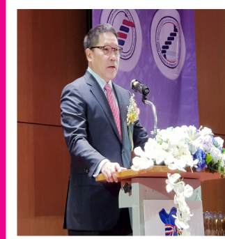
นายอดุลย์ สวายน รัฐมนตรีว่าการกระทรวงการคลัง เป็นประธานในพิธีเปิด