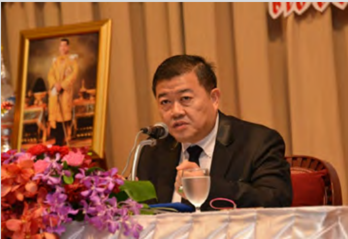
ดร.วิณะโรจน์ ทรัพย์ส่งสุข (อธิบดีกรมส่งเสริมสหกรณ์)

วันที่ 18 พฤษภาคม 2560 ที่ผ่านมา ดร.วิณะโรจน์ ทรัพย์ส่งสุข อธิบดีกรมส่งเสริมสหกรณ์ เป็นประธานเปิดเวทีรับฟังความคิดเห็นเกี่ยวกับเกณฑ์กำกับดูแลสหกรณ์ออมทรัพย์และเครดิตยูเนียน โดยมีผู้แทนสหกรณ์ออมทรัพย์ สหกรณ์เครดิตยูเนียน และหน่วยงานที่เกี่ยวข้อง เข้าร่วมประชุม ณ โรงแรมปรี๊นท์ พาเลซ มหานคร กรุงเทพฯ