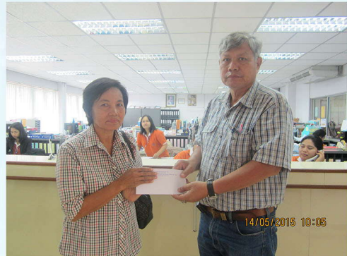
สวัสดิการเกื้อกูลสมาชิกอาวุโส