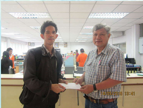
สวัสดิการช่วยเหลือค่ารักษาพยาบาล