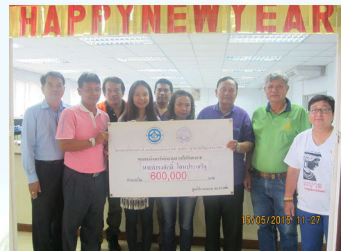
มอบเงินฌาปนกิจสงเคราะห์