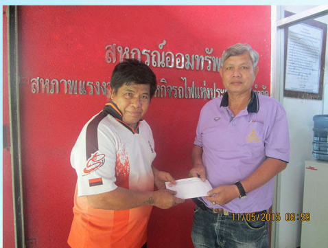
สวัสดิการเกื้อกูลสมาชิกอาวุโส