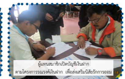
ผู้แทนสมาชิกเปิดบัญชีเงินฝาก ตามโครงการรณรงค์เงินฝาก เพื่อส่งเสริมนิสัยรักการออม