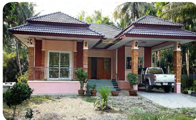
บ้านหลังนี้ได้มาด้วยเงินสหกรณ์ฯ