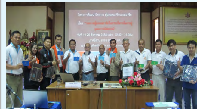
ได้เข้าร่วมโครงการรณรงค์เงินฝาก เพื่อส่งเสริมนิสัยการออม ในช่วงการเดินสายสัมมนาวิชาการให้กับผู้แทนสมาชิก และสมาชิก ภาคตะวันออกเฉียงเหนือ เมื่อวันที่ 13-14 สิงหาคม 2558 ที่ผ่านมา