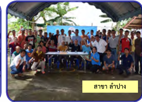
สาขา ลำปาง