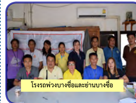
โรงพยาบาลบางซื่อและย่านบางซื่อ