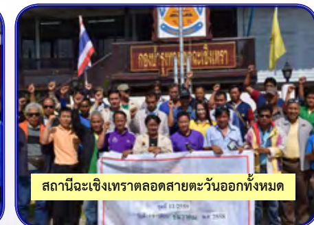
สถานีฉะเชิงเทราตลอดสายตะวันออกทั้งหมด