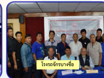
โรงรถจักรบางซื่อ