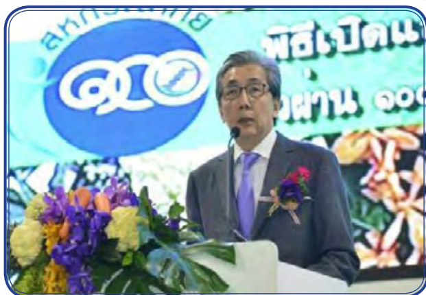
นายสมคิด จาตุศรีพิทักษ์ รองนายกรัฐมนตรี