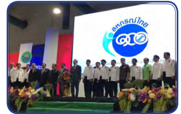
ภาพบรรยากาศภายในงาน “100 ปี สหกรณ์ไทย พัฒนาเศรษฐกิจก้าวไกล สร้างสังคมไทยมั่นคง ณ มหาวิทยาลัยธรรมศาสตร์ ศูนย์รังสิต เมื่อวันที่ 21 ม.ค. 59 ที่ผ่านมามี

ประชากรเหล่านี้จะเป็นกำลังที่สำคัญต่อการพัฒนาฐานที่สำคัญของประเทศ ทั้งทางด้านเศรษฐกิจและสังคม กระทรวงเกษตรและสหกรณ์โดยรัฐมนตรีว่าการกระทรวงเกษตรและสหกรณ์ (พลเอกฉัตรชัย สาริกัลยะ) มีนโยบายส่งเสริมเรื่องการผลิตสินค้าทางการเกษตร การเพิ่มโอกาส ในการแข่งขัน การพัฒนากระบวนการผลิตสินค้าต่างๆต้องทำให้ได้มาตรฐาน การแปรรูปเพื่อเพิ่มมูลค่าการจำหน่าย การตลาดรองรับอย่างต่อเนื่อง รวมไปถึงการพัฒนาการบริหารจัดการและการตลาด ธุรกิจในรูปแบบสหกรณ์ในด้านต่าง ๆ ตั้งแต่การรวบรวมผลผลิต เป็นศูนย์กลางรวบรวมปัจจัยการผลิต แปรรูปผลิตภัณฑ์ การนำเข้าและการส่งออกสินค้า การตลาดชุมชน การตลาดระหว่างประเทศ การดำเนิน ธุรกิจเครดิต ธุรกิจบริการต่าง ๆ ซึ่งสหกรณ์ต้องดำเนินงานให้เป็นธุรกิจเพื่อสังคมอย่างแท้จริง โดยเริ่มจากการ สร้างความเข้มแข็งจากระดับชุมชนขึ้นไป การลงทุนในทุกชุมชนทั่วประเทศ รวมถึงสามารถเพิ่มขีดความสามารถด้านการแข่งขันให้กับประเทศได้อีกทาง ฉะนั้นทั้งหน่วยงานภาครัฐและขบวนการสหกรณ์จำเป็นต้องร่วมมือกันขับเคลื่อนระบบสหกรณ์ให้เป็นกลไกหลักของการพัฒนาประเทศ เพื่อการพัฒนาที่ยั่งยืน สำหรับการจัดงาน “100 ปี สหกรณ์ไทย พัฒนาเศรษฐกิจก้าวไกล สร้างสังคมไทยมั่นคง” ประกอบด้วย กิจกรรมสำคัญ ดังนี้ - การประชุมชี้แจงการขับเคลื่อนกิจกรรม/โครงการ เนื่องในโอกาสครบรอบ 100 ปี สหกรณ์ไทย ที่หน่วยงาน องค์กร จะต้องรับทราบและร่วมขับเคลื่อนกิจกรรม/โครงการตลอดปี 2559 ควบคู่กับการประชุมชี้แจงแนวทางการพัฒนาความเข้มแข็งของสหกรณ์ปี 2559 - 2560 เพื่อยกระดับความเข้มแข็งของสหกรณ์