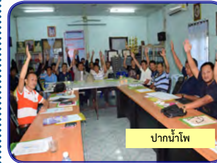
ปากน้ำโพ

ประชุมเลือกตั้งผู้แทนสมาชิกสหกรณ์ฯ ชุดที่ 11/2559 ส่วนสาขาและส่วนกลางระหว่างวันที่ 17 พ.ย. - 18 ธ.ค. 2558