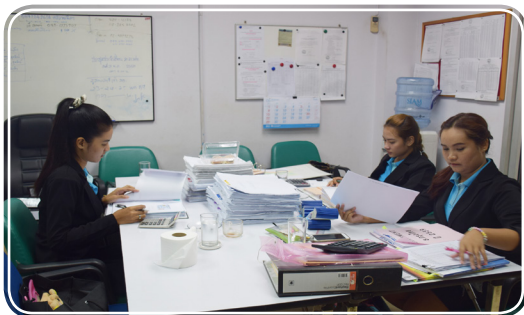
ผู้สอบบัญชี บ.มนตรีสอบบัญชีและกฎหมาย จำกัด

สำหรับโครงการรณรงค์เงินฝากให้กับสมาชิก ดอกเบี้ย ในอัตราพิเศษ ร้อยละ 4.50 คือโครงการเงินฝากประจำ 24 เดือน เพื่อสร้างอนาคต (ยกเว้นภาษี) ระยะเวลาฝาก 24 เดือน โครงการนี้มีระยะเวลา 3 เดือน ตั้งแต่ 3 พฤษภาคม 31 กรกฎาคม 2559 นะคะ ทุกบัญชีที่เปิดใหม่ขึ้นต่ำ