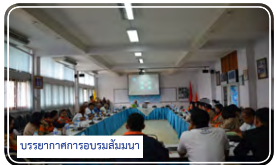
บรรยากาศการอบรมสัมมนา